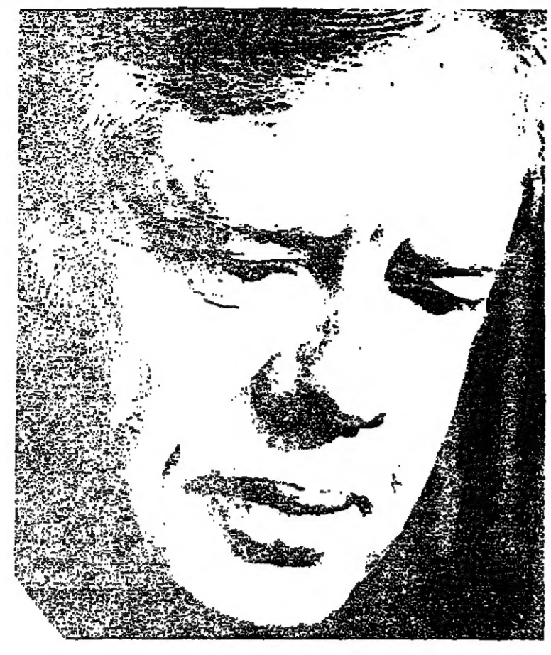
الرئيس الأمريكي جيمي كارتر يعلن عبر شبكات الراديو والتلفزيون تفاصيل العملية الأمريكية في إيران

تل أبيب - يعقد مجلس الحركة الديمقراطية اجتماعا هنا اليوم ليبحث إمكانية الانسحاب من الائتلاف الحكومي. وكان أعضاء هذه الحركة قد قرروا عقد هذا الاجتماع ليبحث الخطوات المتوخاة اتفاقها في هذه المرحلة. وعلم ان أعضاء هذه الحركة سيطلبون الاجتماع مع رئيس الوزراء السيد مئير بيريهن لطرح جميع الأسباب والمشاكل التي يعانون منها. وسيكون افتتاح اجتماع اليوم تأثر كبير على ما سيتم بحثه مع السيد بيريهن ومن المتوقع ان يقوم أعضاء هذه الحركة بتقديم الأسباب التي توجب انسحابهم من الائتلاف الحكومي خلال اجتماعهم برئاسة السيد كريبيا ومنها عدم ارتياحهم من الخطوات الاقتصادية التي تتخذها الحكومة.